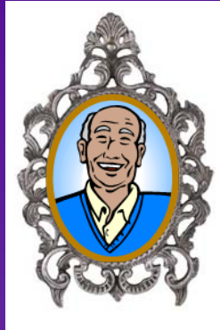
Maître de cérémonie