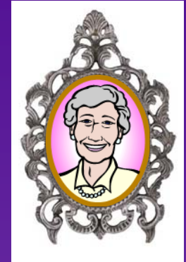
Homme de confiance