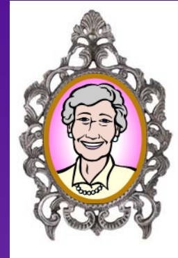
Personnalité de confiance